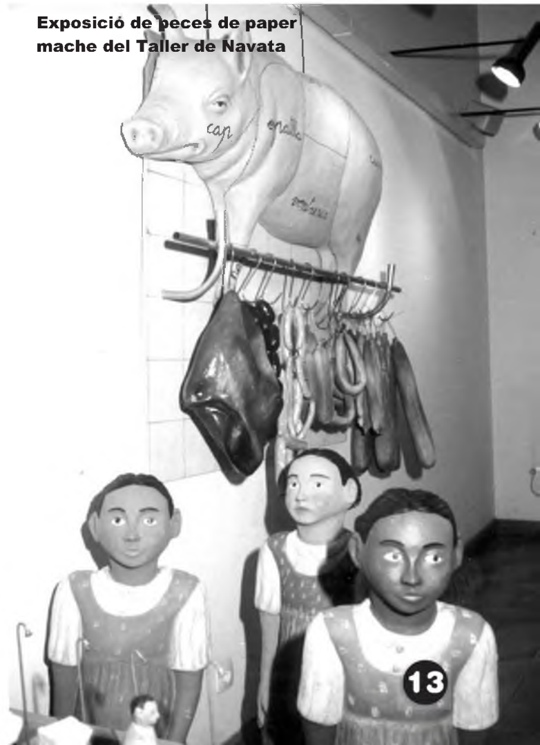
Exposició de peces de paper mache del Taller de Navata